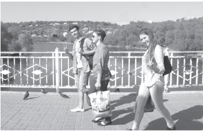
Это берег Свияги...

Кстати, в этом году снова пройдет путешествие по реке «Свияжская кругосветка», возобновленное по дореволюционным маршрутам. В этом году по замыслу его организаторов «кругосветка» пройдет с исследовательской целью: участники отметят на карте все проблемные места. Есть идея сделать то же самое и по берегу, в рамках параллельной велоэкспедиции.