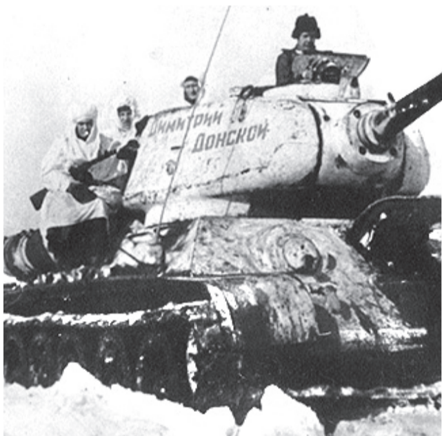
Танковая колонна «Дмитрий Донской», 8 миллионов рублей на которую собрала церковь

По материалам газеты «Православный Симбирск»