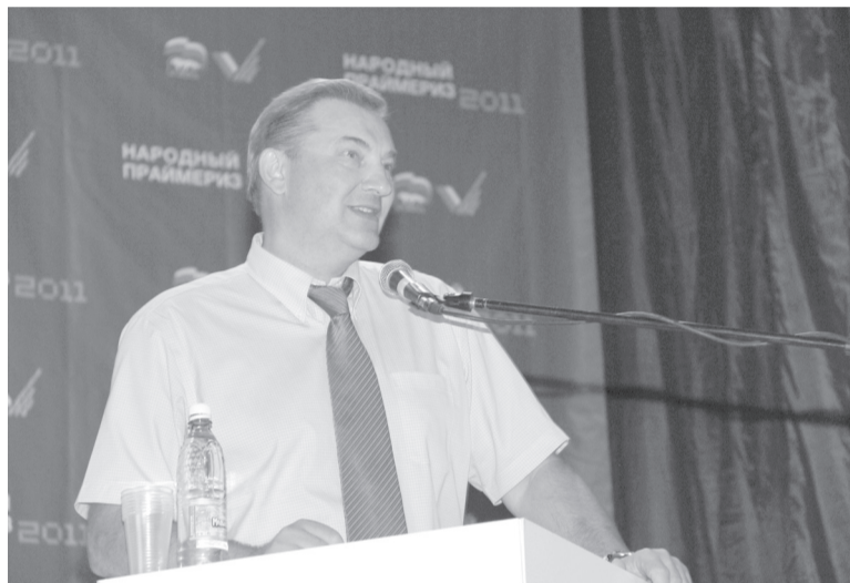
Димитровград, 21 июля 2011 года. Владислав Третьяк впервые выступает на праймериз по выборам в Государственную думу РФ VI созыва, в которой он сегодня представляет Ульяновскую область

Выступая перед участниками праймериз, Сергей Морозов, в частности, сказал: «Мы проводим нашу встречу в очень непростое, очень тревожное время - и для нашего региона, и для России, и для всего мира. Время угроз, вызовов и проблем. Но у нас есть главное условие победы в этом противостоянии - сильный лидер нации, который решительно отстаивает интересы страны, ее суверенитет и целостность, борется за решение проблем каждого россиянина. Не случайно Владимир Путин по оценкам западных экспертов назван самым влиятельным мировым лидером, а уровень доверия президенту со стороны россиян почти ежедневно обновляет исторические максимумы».