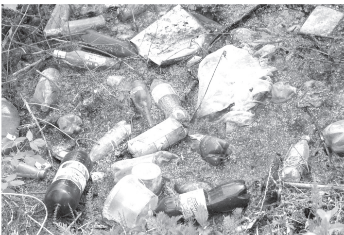
...и это - берег Свияги